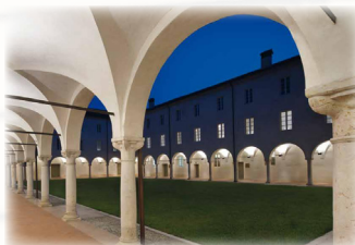
Il Conservatorio: sede del Corso

Il repertorio oggetto di studio sarà il seguente: