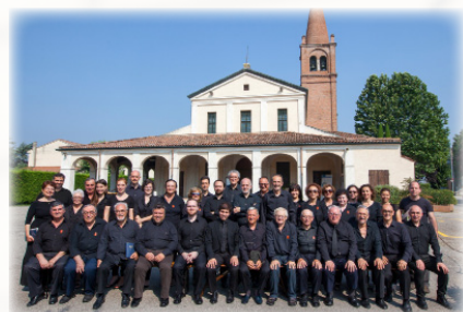
La schola degli allievi dell'edizione 2016, svoltasi al Santuario della Comuna in Ostiglia (MN)

Chi desidera iscriversi al Corso estivo è invitato a compilare entro il 10/06/17 la SCHEDA DI ISCRIZIONE e ad inviarla all'indirizzo accademiacoraleteleion@gmail.com ; è altresì possibile compilare l'apposito form disponibile sul sito www.accademiacoraleteleion.it o iscriversi telefonicamente al numero 370-3153785 dal lunedì al venerdì dalle 18 alle 20. L'iscrizione sarà ritenuta completa al ricevimento del bonifico di pagamento da effettuarsi sul conto corrente intestato a Accademia Corale Teleion , Banca Unicredit di Poggio Rusco, IBAN: IT66R0200857790000103363828, indicando come causale "Iscrizione Corso estivo di Canto Gregoriano NOME COGNOME".