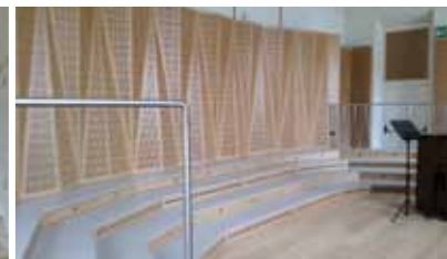
Il Coro (esterno e interno della struttura) prima e dopo il restauro.