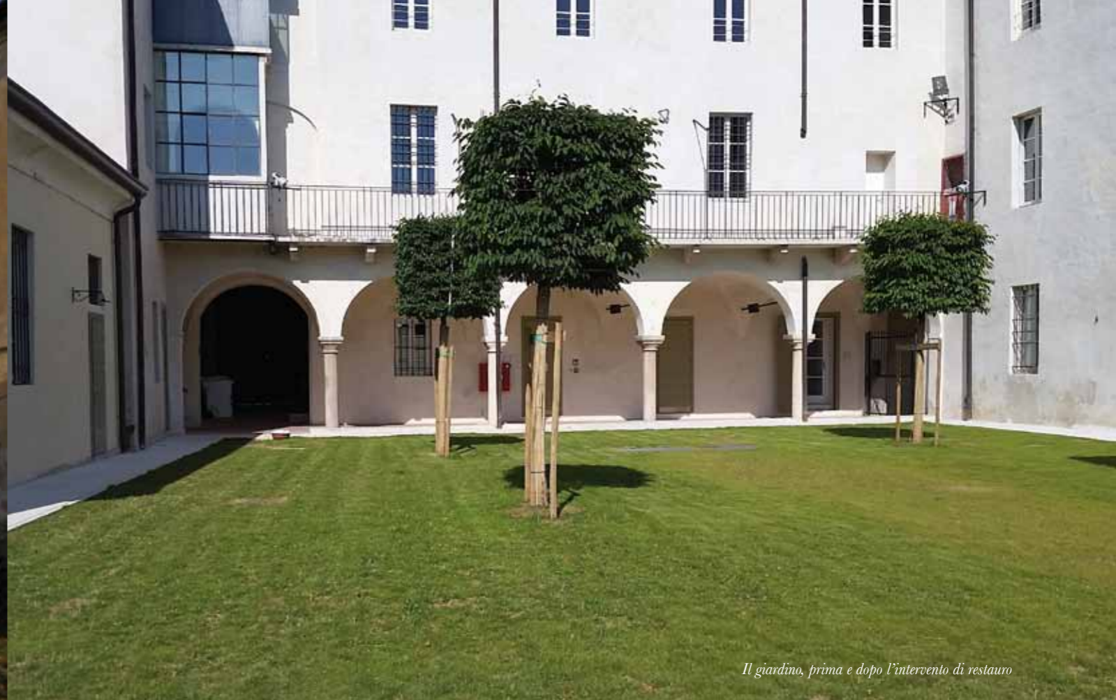
Il giardino, prima e dopo l'intervento di restauro