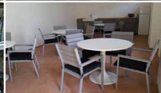
Torretta e zona ristoro, prima e dopo il recupero.